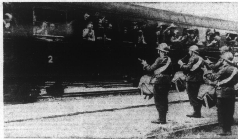
La joyeuse réception des prisonniers français libérés, de passage à SATHONEY (Rhône).

Lire le texte de ces deux ordonnances en seconde page