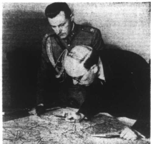
Le Président de la République finlandaise, M. RISTO RYTI, examinant la carte avec un de ses adjutants, le lieutenant A. SKOOR.

V. Kutnow, Narvik, Dunkerque, Salonique, la Grèce, Bialystok, tous ces noms annoncent la victoire, la victoire des armées allemandes. Tous les peuples de l'Europe, même ceux qui, à cause de l'Angleterre ont pris les armes contre l'Allemagne ont reconnu — grâce à la lutte du bolchevisme contre l'Europe — que cette campagne victorieuse allemande amènera la libération et un avenir meilleur pour le monde entier. C'est pourquoi, aujourd'hui, des soldats de tous les pays du continent combattent côte à côte avec l'armée allemande, pleinement conscients que cette victoire de l'Allemagne sur le Bolchevisme sera également la victoire de leur patrie. C'est pourquoi si, aujourd'hui, le grand V apparaît sur les drapeaux des tours de la Karibuecke de Prague, de la tour Eiffel à Paris, dans les rues d'Oslo, d'Amsterdam et de Bruxelles, il ne faut pas seulement voir dans ce signe la reconnaissance des victoires allemandes, mais également la certitude que sous ce signe et sous la conduite allemande l'Europe remportera la victoire définitive.