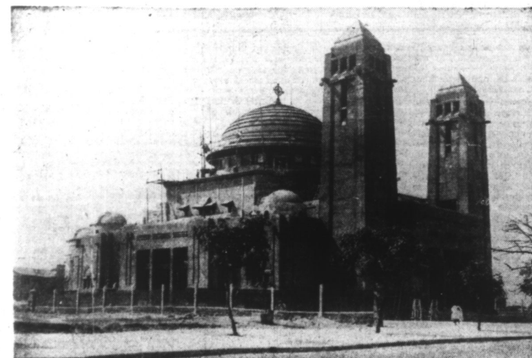
LA CATHÉDRALE DE DAKAR.