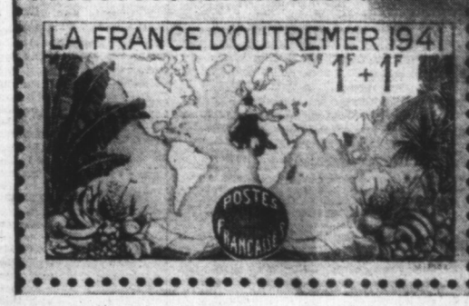
A l'occasion de la « Semaine de la France d'outre-mer », voici le nouveau timbre de 1 franc avec surtaxe de 1 franc dont le produit sera versé au « Secours National ».

Vichy, 21. — Le bulletin officiel publie une loi relative aux attributions de M. Fucheu, nouveau ministre de l'Intérieur. En vertu de cette loi, l'amiral Darlan, vice-président du Conseil, exercera une autorité directe sur le ministère de l'Intérieur. Les projets de lois et de décrets élaborés par ce département devront être approuvés par l'amiral Darlan.