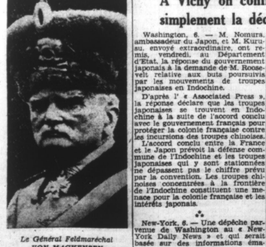
Le Général Feldmaréchal VON MACKENSEN

A Vichy on confirme purement et simplement la déclaration de Tokio