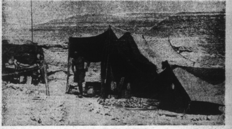
Sur le front de bataille de BARDIA.

Adana, 5. — Un ambassadeur anglais, accompagné de plusieurs officiers irakiens, est parti en mission spéciale pour l'Arabie Saoudite. On admet dans les milieux arabes que ce voyage est en corrélation avec l'union personnelle projetée depuis des mois, entre la Saoudite et la Syrie.