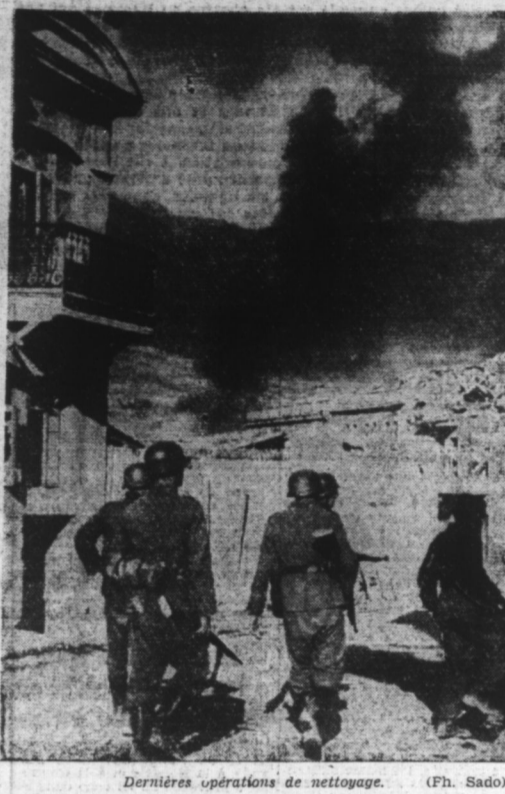
Dernières opérations de nettoyage.

Berlin, 6. — La bataille dans le désert Nord-Africain et les succès remarquables remportés par le général Rommel, ont produit une répercussion très importante sur le peuple anglais.