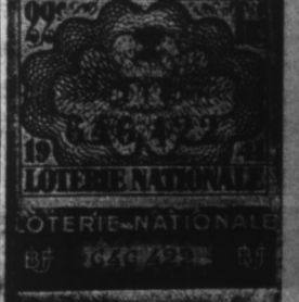
LOTERIE NATIONALE DIXIEMES

Paris, 6. — Le ministère de l'Information annonce que pour intensifier la lutte contre les communistes, dans la région de Bordeaux, le contrôleur général de la police française s'est rendu en mission spéciale à Bordeaux.