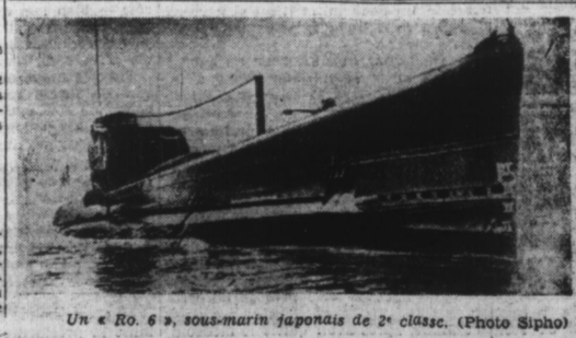
Un « Ro. 6 », sous-marin japonais de 2 e classe.

Vichy, 13. — Concernant la nouvelle répandue de source étrangère, relative à la déclaration de la mobilisation générale par le gouvernement de l'Indochine française, on déclare de source autorisée que cette nouvelle est inexacte.