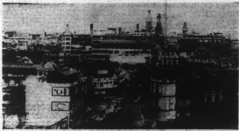
Vue des concessions internationales de SHANGHAI..

Nankin, 13. — Le porte-parole de l'Armée japonaise a déclaré qu'après la prise de Kaulun, le commandant en chef des forces japonaises opérant contre Hong-Kong, avait demandé la reddition de la ville, pour éviter de nouveaux massacres. Il a précisé dans sa demande que l'île de Hong-Kong était maintenant livrée à l'armée d'encerclement japonaise et se trouvait sous le feu des canons japonais. Si cette offre n'est pas acceptée, il avertit de nouvelles pertes énormes à la population chinoise innocente. Le porte-parole de l'Armée japonaise a déclaré que la prise de Hong-Kong était la dernière position de l'Angleterre sur le continent de l'Asie orientale. En cas de refus, l'occupation de la ville ne serait qu'une question de temps. Tokio, 13. — M. Kikuo Koda qui y a peu de temps encore était Consul du Japon à Hong-Kong, a déclaré, au cours d'une interview, au sujet de la prise de Kaulun : « L'île de Hong-Kong, qui est distante de sept minutes de Kaulun lorsqu'on emprunte le bateau de passage, peut être aisément dévastée si on la bombarde de Kaulun. » « Au point de vue militaire, Kaulun est plus importante que l'île mesme de Hong-Kong, car il s'y trouve des dépôts de munitions, une station de T.S.F. et un important aérodrome. » « La prise de Kaulun n'a pas seulement annihilé l'importance stratégique de Hong-Kong, mais a porté un coup dur au régime de Tchang-Kai-Chek, toutes les voies de communication entre Tchouang-King et