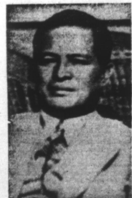
Le Général OSHIMA Ambassadeur du Japon à BERLIN.