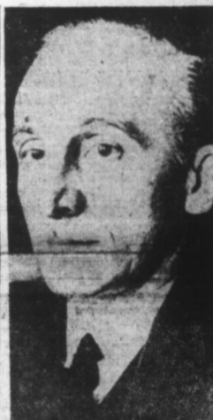
M. VON BARDOSSY Président du Conseil hongrois.

Budapest, 13. — On annonce officiellement que vendredi, M. von Bardossy, président du Conseil et ministre des Affaires étrangères, a remis la note suivante au ministre des Etats-Unis à Budapest. « Le ministre royal hongrois des Affaires étrangères a l'honneur de porter à la connaissance de son Excellence le ministre des Etats-Unis à Budapest, ce qui suit : » Se basant sur le pacte de Trois, daté du 27 septembre 1940 et sur l'adhésion à ce pacte de la Hongrie en date du 20 novembre 1940, et fidèle aux principes de solidarité exprimés le 11 décembre de cette année et relatifs à l'état de guerre existant entre l'Empire allemand, l'Italie et le Japon d'une part, et les Etats-Unis d'autre part, le gouvernement royal hongrois se considère également en état de guerre avec les Etats-Unis. » Sofia a également déclaré la guerre à l'Angleterre. Sofia, 13. — La Bulgarie a déclaré la guerre à l'Angleterre et aux Etats-Unis. La déclaration de