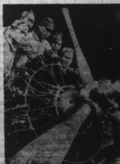
Un groupe d'élèves aviateurs japonais étudiant un moteur.

Vichy, 13. — Samedi, un transport de 140 prisonniers français venant de camps italiens, est arrivé à St-Jean de Maurienne, dans le département de la Savoie. Il s'agit du premier transport de prisonniers français libérés d'Italie.