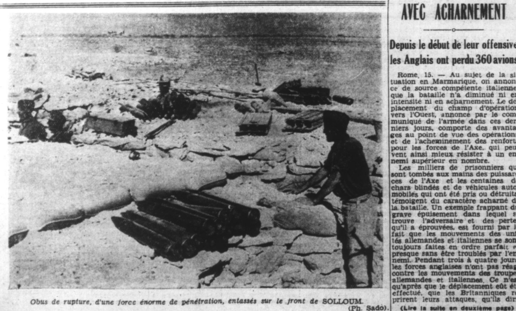
Obus de rupture, d'une force énorme de pénétration, entassés sur le front de SOLOUIM. (Ph. Sadou).