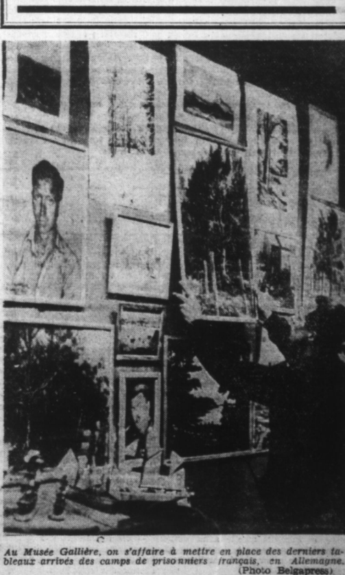
Au Musée Galliera, on s'affaire à mettre en place des derniers tableaux arrivés des camps de prisonniers français, en Allemagne.