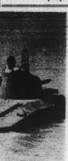
Tanks amphibies japonais en action.

Les ambassadeurs d'Italie et du Japon assistaient à cette réunion que présidait M. VON RIBBENTROP