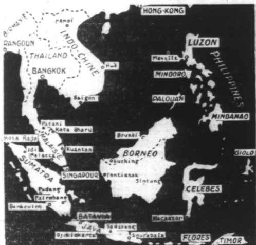
Sur cette carte, on voit, en haut, la base anglaise d'HONG-KONG sur la côte méridionale de Chine, puis l'île de LUZON (Luzon), les troupes nippones menacent MANILLE. Plus bas, à gauche, SINGAPOUR ainsi que MALACCA, également visés par les attaques nippones. Au milieu, l'île de BORNEO (Hollande), dont le nord est une possession britannique..

Sous les coups répétés de l'artillerie et de l'aviation nippones les positions de défense de Hong-Kong cèdent rapidement