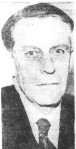
L'amiral FERNET, Secrétaire-général du Conseil National à Vichy.

Il y a lieu d'attendre pour constater si un accord relatif à une future politique commune des deux puissances dans cet espace est réalisable, étant donné que l'aneantissement de la position américaine entraîne une menace pour la position britannique dans la presqu'île