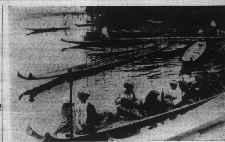
Un cours d'eau de la BIRMANIE ; les embarcations plates et étroites sont caractéristiques.

Des avions de combat allemands ont incendié des quais du port de Tobrouk. D'autres attaques ont été dirigées contre le nœud terminus important de Abu Schaidan (nord de l'Egypte). Un sous-marin sous le commandement du capitaine Paulsen a attaqué dans la Méditerranée orientale, devant Alexandrie, une flottille de croiseurs britanniques et a coulé par des torpilles un croiseur qui fut coupé en deux après une terrible explosion, sombrant après quelques minutes.