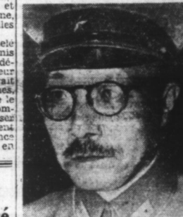
Le général Hideo TOJO, Premier Ministre de la Guerre du Japon.

Comme l'explique clairement le communiqué de l'armée d'aujourd'hui, les troupes germano-italiennes passent de leur côté à la contre-attaque et remportent ainsi des succès remarquables.