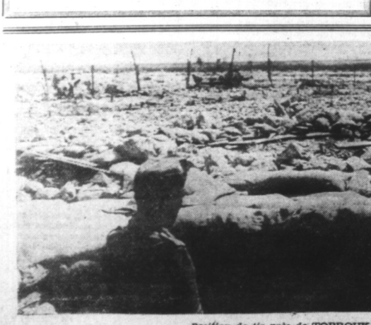
Position de tir des TOBROUK.