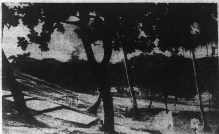
Paysage de l'île de BORNEO.

Tokio, 16. — L'agence Domé mande d'une base de l'armée nip-