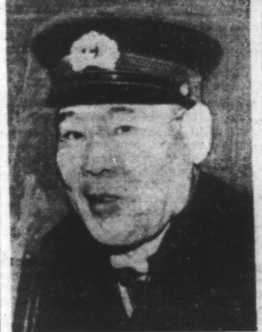
L'amiral NAGANO, Commandant la flotte japonaise.

Tokio, 16. — L'amiral Shimada, ministre de la Marine, a donné aujourd'hui à la Diète, un aperçu des opérations de l'armée japonaise contre les îles Hawaï, Wake et Mid-