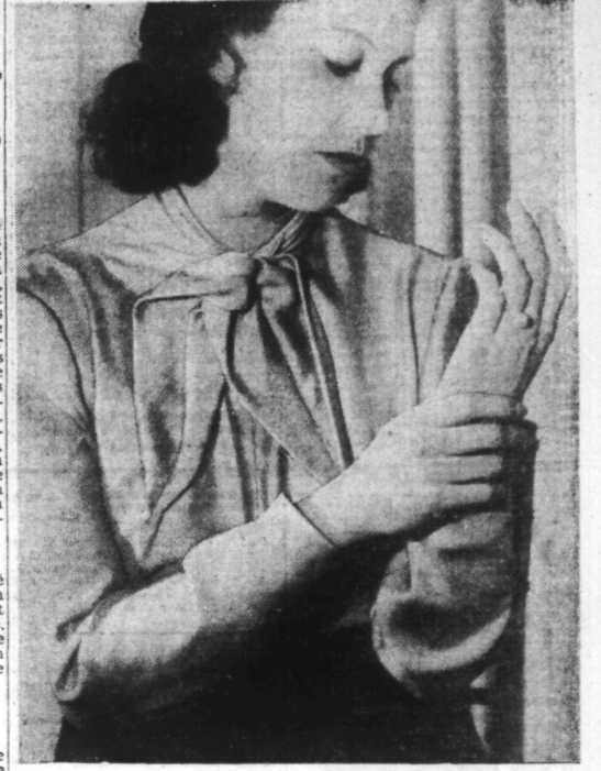
BLOUSE en surrah cyclamen. Création Marcelle CHAUMONT.

Mélangez 8 kilos de poussier de charbon avec 1 kilo 500 de argile blanche et assez d'eau pour former une pâte compacte.