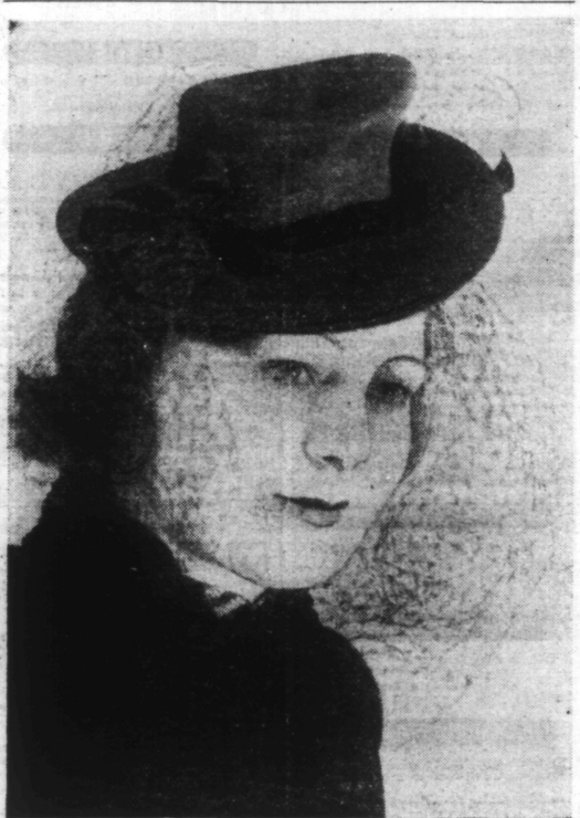
CHAPEAU en feutre et noir brillant, garni d'un ruban. (Ph. Stella-Pressa). Création Marcelle CHAUMONT.

On se teint encore les cheveux, on se les teindra toujours, pas seulement pour réparer des ans irrémédiables outrages, mais pour suivre la mode et puis aussi parce que les messieurs préfèrent les blondes aux brunes.