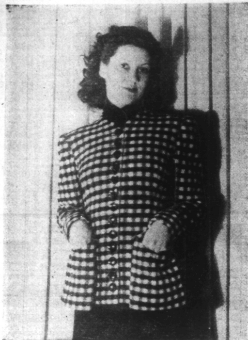
JAQUETTE à carreaux noir et blanc. Création Marcelle CHAUMONT.