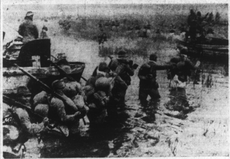
Détachement d'infanterie japonaise traversant un fleuve, à gué, avec son équipement.