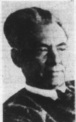
M. MANUEL L. GUSZON, Président du Sénat et homme d'Etat le plus important des Philippines où il représente le Gouvernement américain.

Amsterdam, 19. — Les milieux gouvernementaux de Londres qualifient officiellement la situation de Hong-Kong de sérieuse, après le débarquement des troupes japonaises dans l'île. On avait confiance dans la capacité de résistance de la garnison de l'île qui, d'après certains, devait se prolonger au moins trois mois pour permettre aux marines