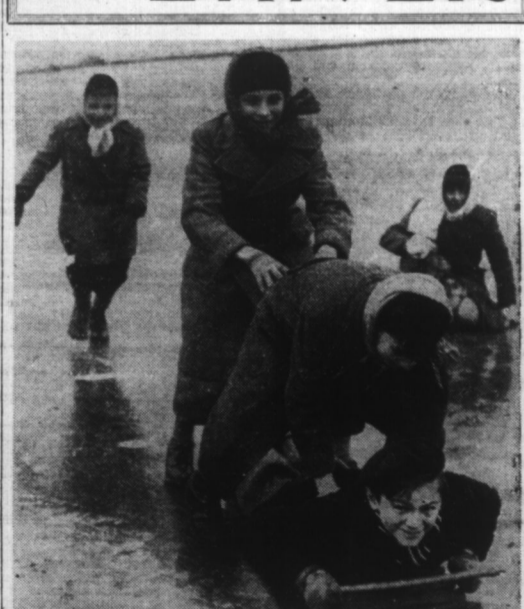
Que de belles parties en perspective pour nos écoliers ! Pas pour les chausures, ni les vêtements par exemple, deux choses qui donnent bien des soucis aux parents actuellement.