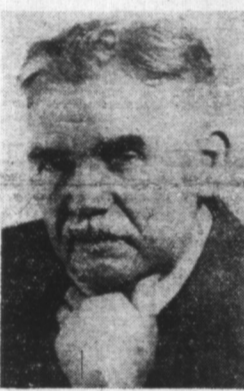
Grâce à l'initiative personnelle du Maréchal Pétain, les expériences du savant Georges Claude vont recevoir un appui officiel. C'est sur la Côte d'Ivoire, près d'Abidjan, qu'une station d'énergie thermique des mers sera créée et qu'un organisme étudiera les avantages de ce procédé qui pourra nous fournir du courant électrique à un prix de revient très bas. Ci-dessus un portrait de Georges CLAUDE.