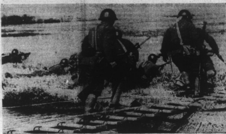
TROUPES JAPONAISES EN ACTION.

Rio de Janeiro, 20. — Un communiqué du département de la Marine américaine annonce que hier les Japonais ont attaqué à deux reprises l'île de Wake. D'importantes formations aériennes ont participé au second raid. (Suite en 2 e page.)