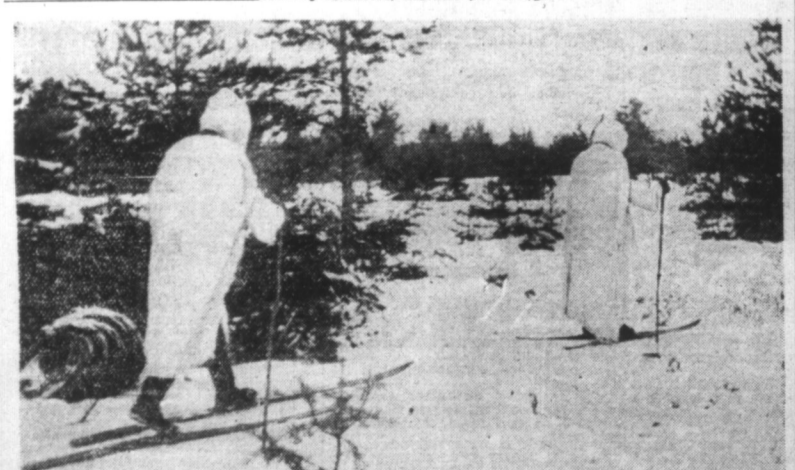
Pionniers allemands traversant un petit bois dans la région de LENINGRAD.