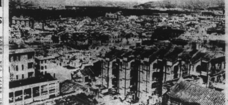
Une vue récente de HONG-KONG. Dans le lointain, le port entouré de hauteurs vers lesquelles les Japonais ont effectué leur débarquement.

Amsterdam, 21. — On apprend de Manille que le Quartier Général d'est plus en communication avec Davao, dans l'île Mindanao, depuis