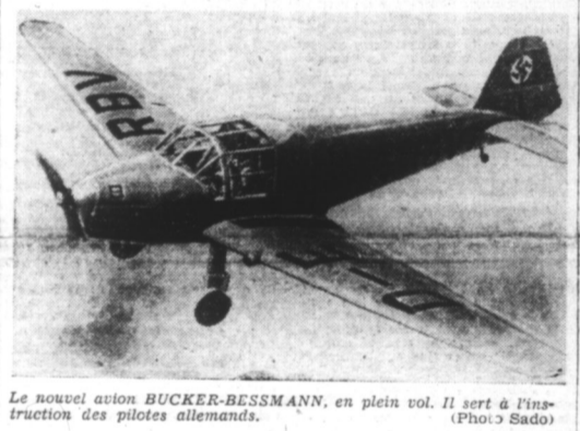
Le nouvel avion BUCKER-BESSMANN, en plein vol. Il sert à l'instruction des pilotes allemands.

Berlin, 21. — Pendant la nuit dernière, l'aviation allemande a mis en ligne d'importantes forces pour