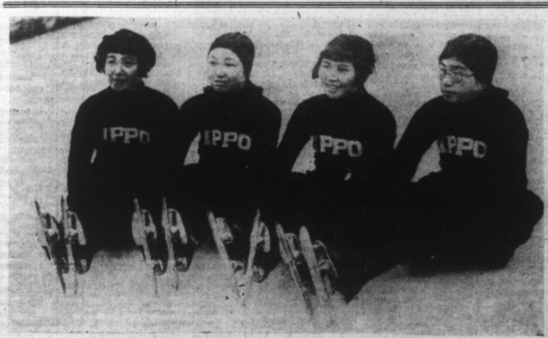
Patineuses Japonaises prenant quelque repos..

(LIRE EN DEUXIÈME PAGE LE COMMUNIQUÉ ITALIEN).