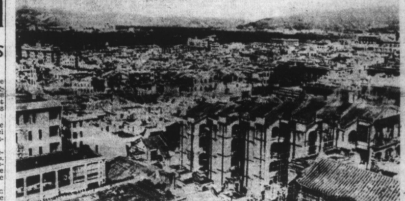
Une vue récente de HONG-KONG. Dans le lointain, le port entouré de hauteurs vers lesquelles les Japonais ont effectué leur débarquement.

Amsterdam, 21. — On apprend de Manille que le Quartier Général d'est plus en communication avec Davao, dans l'île Mindanao, depuis