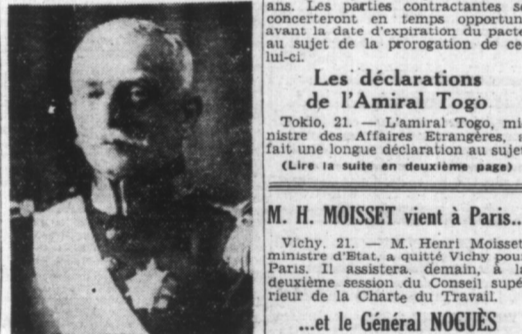
Le Général CARMONA, Président du PORTUGAL.

Lisbonne, 21. — La presse commente longuement le discours du premier ministre Salazar. Le « Diário de Notícias » écrit que les événements qui se sont produits, mercredi, à Timor, constituent non seulement une violence inutile, mais une grande faute. La conscience mondiale ne peut tolérer sans protester que des troupes