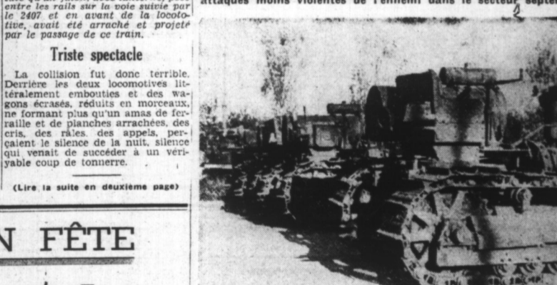
Le matériel capture lors des combats d'ODESSA est préparé pour l'inventaire.