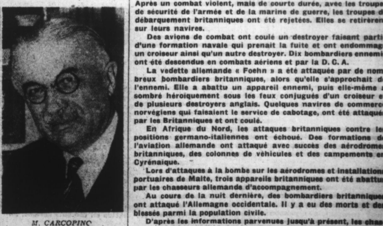
M. CARCOPINO