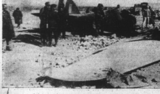
Avions anglais abattus lors d'une violente attaque en Afrique du Nord.

Rio de Janeiro, 28. — On mande de Washington que samedi dernier la commission maritime des Etats-Unis a fait saisir seize navires finlandais mouillés dans les ports américains.