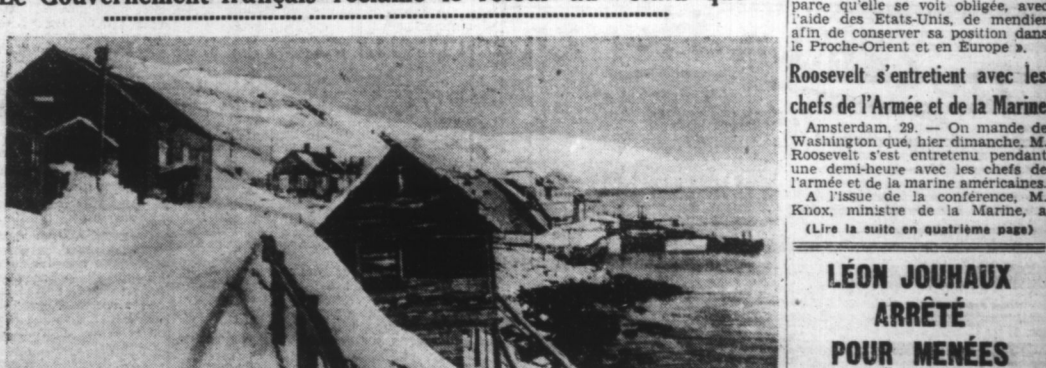
L'île de SAINT-PIERRE ET MIQUELON qui, défendue par 5 gendarmes, a été occupée par les Gaultistes.

Le Gouvernement français réclame le retour au « statu quo »