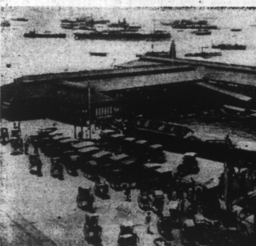
Une vue du port de PENANG (côté nord-ouest de la presqu'île de Malacca) qui a été bombardé par les Nippons.

Bangkok, 29. — L'Agence Domei annonce qu'à la suite du passage des pénales, avaient occupé de nouvelles positions au sud de la ville.