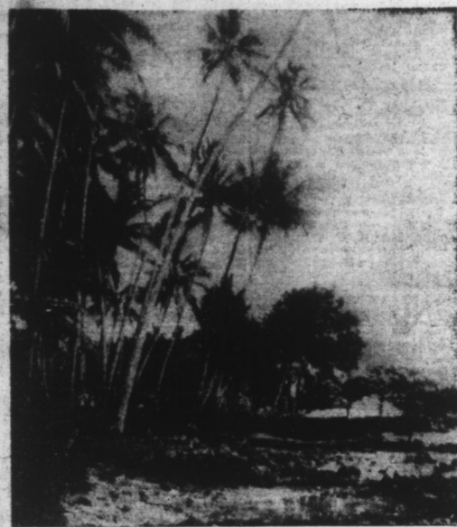
Un aspect des îles Gilbert où les Japonais ont débarqué récemment.

Il est hors de doute qu'il entre dans les intentions des Japonais de mettre à profit, jusqu'à l'extrême limite, leur supériorité actuelle sur mer et dans les airs et ce, afin de