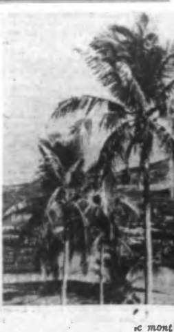
Le mont MAYON (2.117 mètres), aux Philippines.

Vichy, 2. — La radio française de ce jour ne s'occupe à priori position de la France. M. Churchill et les hommes à sa solde entendent par conséquent d'oursour proclamer par M. Churchill à Ottawa, prononce ainsi : « M. Churchill a dit : « M. Churchill a déclaré qu'il n'avait pas déclenché cette guerre, nous nous permettons de ne pas être de son avis et de déclarer, au contraire, qu'il a fait tout pour nous entraîner dans le conflit. M. Churchill a parlé en des termes méprisables de l'écroulement de l'armée française et de la confusion totale dans laquelle la nation française aurait été plongée. N'en déplaise à M. Churchill, il faut constater que ce furent les divisions britanniques qui, à notre insu et malgré l'existence d'un ordre défensif, s'étaient repliés pour s'embarquer. » En ce qui concerne la confusion dans laquelle la France aurait été précipitée, nous faisons remarquer que Churchill a fait tout ce qu'il faut en son pouvoir pour augmenter cette confusion en déclançant sur nous sa propagande et ses émissions radio-phoniques dans le but de rompre l'unité française. Nous savons ce que M. Churchill et les hommes à sa solde entendent par « nous » : ce sont ceux qui ne trahissent pas leur pays en faveur de l'Angleterre. Nous savons également ce que M. Churchill entend par « gouvernement de Vichy » : un gouvernement qui n'est pas parvenu à acheter la trahison.