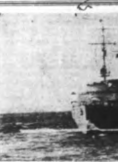
Unités de la Marine, en patrouille, à la file indienne.

Tokio, 2. — On mande du front de Malaisie que les troupes australiennes commandées par le lieutenant (Lire la suite en quatrième page).