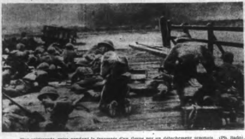
Vue sous-marine, prise pendant la traversée d'un fleuve par un détachement japonais.

AVIS L'Obertidkommandantur 070 à Lille communique : Les pigeons voyageurs lâchés par l'ennemi (avec ou sans appareil de chute), sont à remettre par la population à la Kreisobertidkommandantur compétente pour l'arrondissement. En échange une récompense de 500 à 1.000 francs sera accordée pour chaque remise.