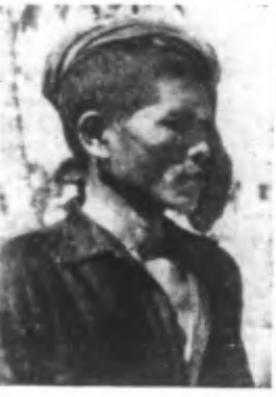
Type de Philippin mahométan de la province de COTABATO (MINDANAO). (Ph. Siphon).

Amsterdam, 3. — On mande de Washington au Service d'Informations britannique que le gouvernement philippin est parti pour transférer son siège à Port-Darwin, en Australie.