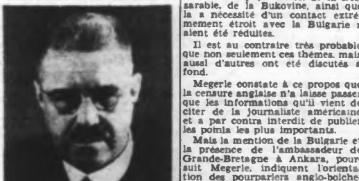
M. ROLF WITLING, le nouveau Ministre des Affaires étrangères de Finlande.

Berlin, 9. — Dans un article intitulé « Pleins pouvoirs pour Staline », Karl Megerlé, collaborateur du « Berliner Boersen-Zeitung », pour la politique étrangère, s'occupe de la concession faite par l'Angleterre à l'Union Soviétique concernant la prédominance en Europe.