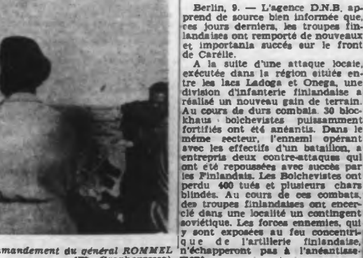
En LIBYE, les troupes germano-italiennes sont placées sous le commandement du général ROMMEL. On voit ici s'apprêtant à descendre d'un char d'assaut.

Berlin, 9. — L'agence D.N.B. apprend de source bien informée que, ces jours derniers, les troupes finlandaises ont remporté de nouveaux et importants succès sur le front de Carélie.