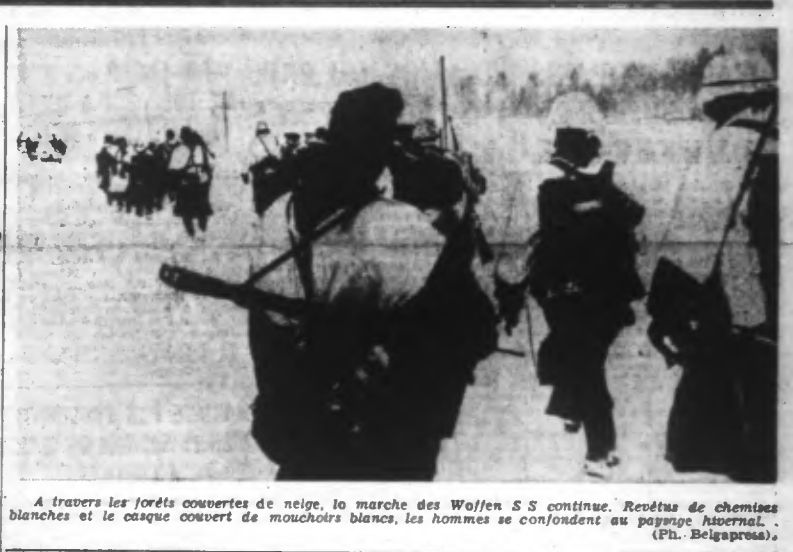
A travers les forêts couvertes de neige, le marche des Waffen S S continue. Revêtus de chemises blanches et du casque couvert de mouchoirs blancs, les hommes se confondent au paysage hivernal.