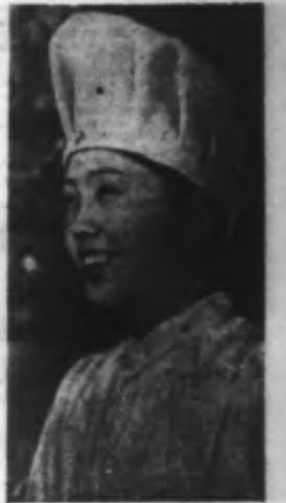
Infirmière Japonaise.

Au cours de l'après-midi du 9 janvier, l'aviation de l'armée japonaise a attaqué le port de Mouimein (Birmanie) dans le golfe de Martaban; elle a touché en plein un navire de fort tonnage et a également tou-