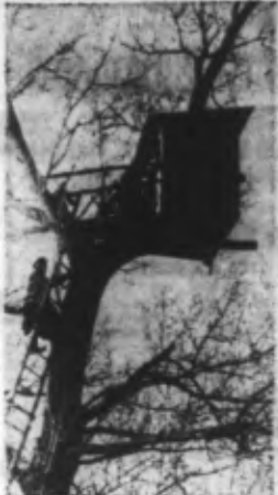
Un curieux poste d'observation établi au sommet d'un arbre, sur la côte de la Manche. (Ph. Sado).

La visite de courtoisie que vient de faire à Budapest le Ministre des Affaires Étrangères du Reich, M. von Ribbentrop, n'a pas été une simple manifestation d'un caractère banal... Elle a été l'occasion pour M. von Ribbentrop de réaffirmer son inaltérable attachement à la cause de l'indépendance des peuples.