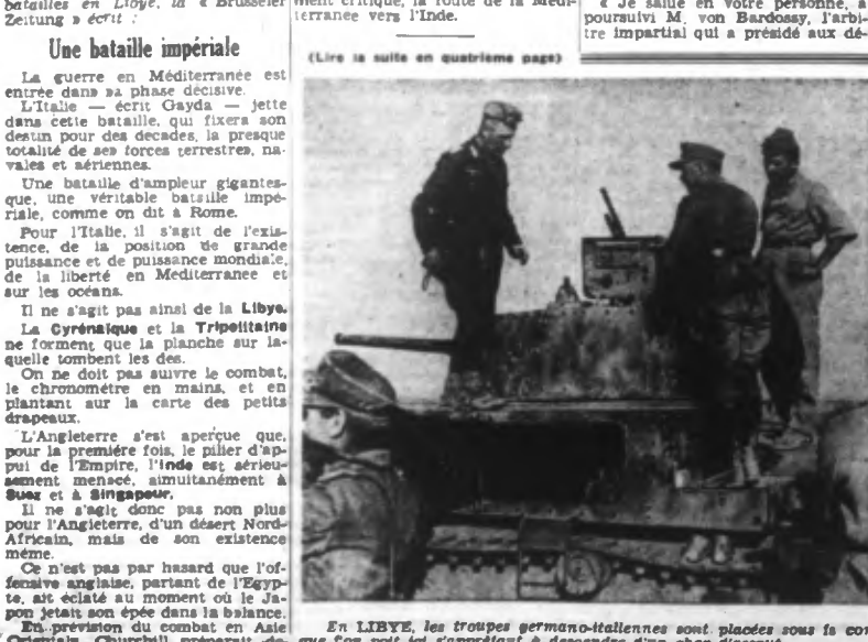
En LIBYE, les troupes germano-italiennes sont placées sous le commandement du général ROMMEL. On voit ici s'apprêtant à descendre d'un char d'assaut.

Sur la situation telle qu'elle se présente, à la suite des récentes batailles en Libye, la « Brussels Zeitung » écrit :