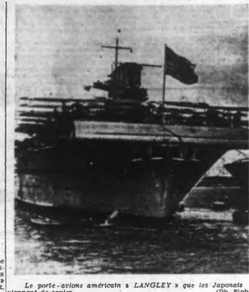
Le porte-avions américain « LANGLEY » que les Japonais viennent de couler.

Sur l'importance du Thailand dans la guerre asiatique, le « National Zeitung » écrit : Le Thailand, ancien Siam Le nom de Thailand n'a remplacé celui de Siam que ces dernières années. Ce royaume de l'arrière-Inde est entouré, à l'est et au nord, par l'Indochine française, à l'ouest par la Grande-Bretagne. Au sud s'étend une petite bande de terrain pénétrent dans la presqu'île de Malacca. Dans la partie centrale du pays se trouvent les plaines de Menam, les champs de riz, très fertiles, qui sont inondés en été. Au début de notre ère, le groupe ethnique des Thaïs a pénétré à travers le pays montagneux du Siam du nord, et par la vallée du Menam, vint dans le Chind du sud. De là le nom de Thailand donné aujourd'hui au pays. La population totale du Thailand est de 12 à 13 millions d'habitants, dont un million de Chinois, 500.000 Hindous et Malais et un nombre important de Japonais. Au nord de l'Empire, à l'ouest de l'Indochine, des troupes indo-britanniques avaient pénétré, par les montagnes de Birmanie, hautes de plus de 2.000 mètres, après la déclaration de guerre du Japon. Mais elles ont été repoussées. (Lire la suite en deuxième page)