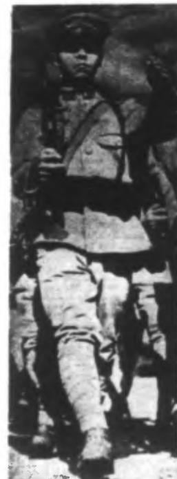
Fantassin nippon.

Tokio, 10. — Les troupes japonaises qui opèrent en Malaisie ont occupé aujourd'hui Kuala Lumpur.