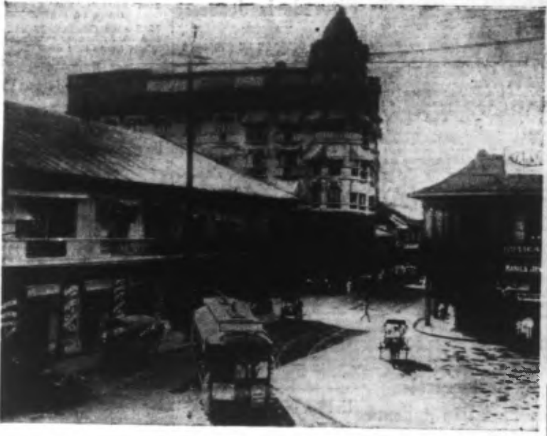
Un coin pittoresque et des plus importants de MANILLE.