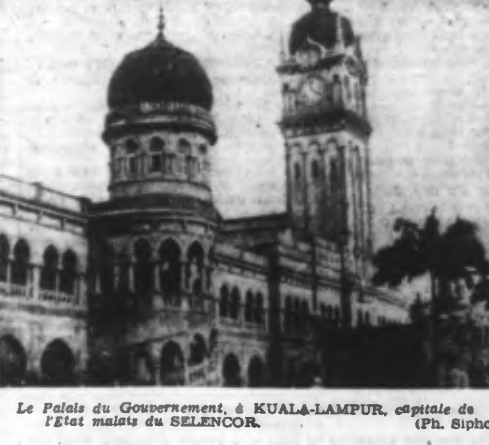
Le Palais du Gouvernement, à KUALA-LUMPUR, capitale de l'Etat malais du SELENCOR.

Amsterdam, 10. — Duff Cooper, ministre britannique permanent à Singapour, vient d'être invité, annonce le service anglais des Informations, à mettre fin à sa mission et à rentrer à Londres. Un communiqué du Foreign Office dit entre autres : « Les mesures prises à Washington en corrélation avec la nomination du général Wavell aux fonctions de commandant en chef dans le Sud-Ouest du Pacifique, metten fin à la mission de Duff Cooper. Celui-ci a été invité par le Gouvernement de sa Majesté à liquider les derniers travaux de sa mission et à rentrer au pays ».