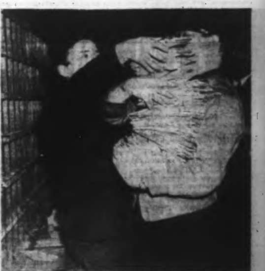
Un facteur du service de « tri », bien chargé.