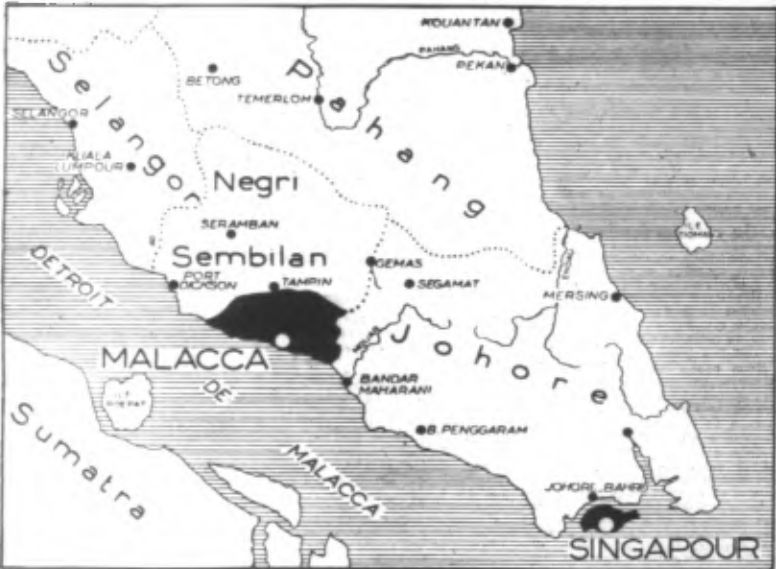
Service Cartographique du « REVEIL ».

Ils ont occupé l'île fortifiée de Devito, au Nord-Ouest de Manille