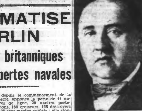
Le docteur FUNK.

Berlin, 16. — M. Funk, ministre de l'Économie du Reich, a prononcé jeudi un discours à l'Institut d'Économie de Berlin, sur le thème : « Le visage économique de la nouvelle Europe ». Assistent à cette séance les représentants du gouvernement allemand, du corps diplomatique ainsi que de l'état, du Parti et de