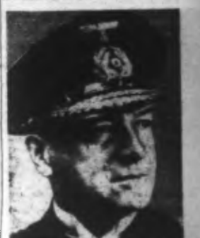
Le grand-amiral RAEDER.

Berlin, 16. — On communique de sources compétentes : Le grand-amiral Raeder, commandant en chef de la Marine de guerre allemande, et l'amiral Riccardi, chef de l'état-major de la Marine de guerre italienne, se sont rencontrés à Garmisch, les 15 et 16 janvier.