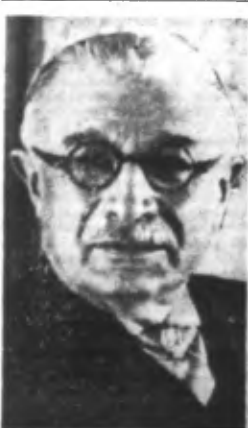
M. CARCOPINO, Ministre de l'Éducation Nationale. (Ph. Siph).

UNE ENQUÊTE DE L'AMIRAUTÉ METTRA EN RELIEF LA BELLE CONDUITE DE TOUS LES SAUVETEURS