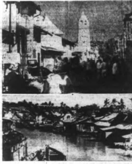
MALACCA : La ville européenne (en-dessus) et la ville indigène. (Ph. Graphopresse).