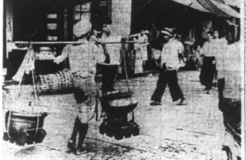
L'aspect pittoresque d'une rue dans le quartier indigène de MANDALAY qui vient d'être occupé par les Japonais.

Tokio, 4. — Le porte-parole de l'armée japonaise communique : Dans leurs efforts désespérés pour contenir l'avance japonaise, les forces unies anglo-chinoises employèrent des gaz toxiques et ont empoisonné des puits, des cours d'eau et des réservoirs à eau en dépit des prescriptions des droits des gens. L'officier déclara que la 22 e division de Tchoung King, nouvellement constituée, a attaqué le 12 avril les Japonais aux environs de Thagaya, à près de 200 kilomètres au sud de Mandalay.