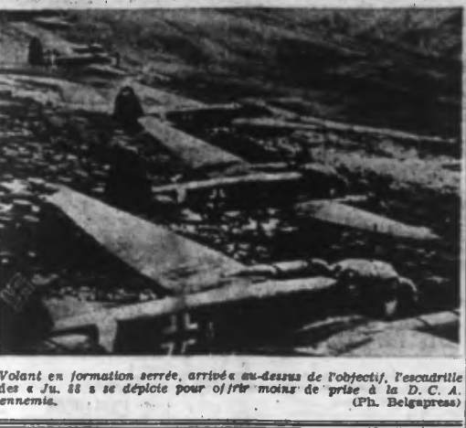
Volant en formation serrée, arrivés au-dessus de l'objectif, l'escadrille des « Ju. 88 » se déploie pour ouvrir « moins » de la D.C.A. ennemie.

En représailles des attaques terroristes des bombardiers britanniques contre les villes allemandes, dans la nuit de lundi, de fortes escadrilles d'avions de combat ont attaqué à nouveau le port d'Exeter avec des bombes explosives et incendiaires. Des tentatives de l'aviation britannique d'attaquer hier la côte de la Manche, sous une forte protection de chasseurs, ont été repoussées avec des pertes élevées pour l'ennemi. Les chasseurs allemands et la D.C.A. ont descendu à cette occasion dix avions ennemis.