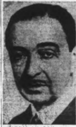
M. DE LEQUERICA, Ambassadeur d'Espagne en France, a été reçu lundi, dans le matin, par le maréchal Pétain, qui a reçu également l'amiral Darlan et le général Arrière.

Paris, 4. — C'est en présence du cardinal Suhard et des représentants de l'autorité que les funérailles d'une partie des victimes de l'agression anglaise sur la région parisienne se sont déroulées dans le quartier de la banlieue le plus atteint. Environ 150.000 personnes ont défilé devant la bibliothèque de la ville, où les victimes du bombardement anglais récent avaient été mises en bière. M. Lagardelle, ministre du Travail, représentant le maréchal Pétain, était présent à cette manifestation, tandis que l'ambassadeur de Brinon, secrétaire d'Etat, y prit part comme délégué du gouvernement. Laval et l'amiral Platon comme délégués de l'amiral Darlan, chef des forces armées françaises. L'hommage du Gouvernement L'ambiral Platon a prononcé un discours où il a dit notamment : « Le martyrologe des victimes françaises d'aujourd'hui a été déclaré le secrétaire d'Etat auprès du Gouvernement français. (Lire la suite en deuxième page) »