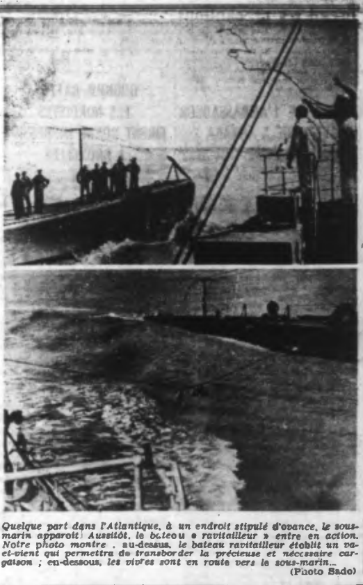
Quelques parts dans l'Atlantique, à un endroit stupéfié d'opacité, le sous-marin allemand « U-107 », le bateau ravitailleur « entra en action. Notre photo montre, au-dessus, le bateau ravitailleur établi en un va-et-vient qui permettra de transporter la précieuse et nécessaire cargaison ; en-dessous, les vagues sont en route vers le sous-marin.

En Afrique du Nord des escadilles allemandes ont dispersé des concentrations de camions britanniques et ont lancé des bombes sur des avions au sol, alignés sur un aérodrome dans le désert. Sur l'île de Malte des ouvrages fortifiés et des aérodromes furent bombardés effacement ainsi que des navires au large de l'île Gozzo. De jour des avions de combat légers ont coulé au large de la côte méridionale anglaise, un navire de commerce de 2.500 tonnes ainsi qu'un bateau vigie. D'autres attaques furent dirigées sur les objectifs militaires d'un port situé au Nord de Douvres. Ainsi que nous l'avons déjà annoncé par communiqué spécial des sous-marins allemands ont coulé devant la côte orientale de l'Amérique et dans la mer caribéenne, 22 navires marchands jaugeant en tout 138.000 tonnes. Ils endommagèrent par ailleurs deux vapeurs de 17.000 tonnes par des torpilles en plein but. Des bombardiers britanniques ont, la nuit passée, effectué des vols de harcèlement sans aucun but militaire sur l'Allemagne occidentale et sud-occidentale. Des chasseurs de nuit et la D.C.A. ont abattu sept des appareils assaillants après que de jour déjà cinq avions ennemis furent anéantis pendant des engagements aériens au-dessus des côtes de la Manche. Lors des succès remportés par les sous-marins allemands, le sous-marin commandé par le capitaine de corvette Zapp, s'est tout particulièrement distingué. L'Oberleutnant Ostermann, a obtenu hier ses 95-96 e victoires aériennes.