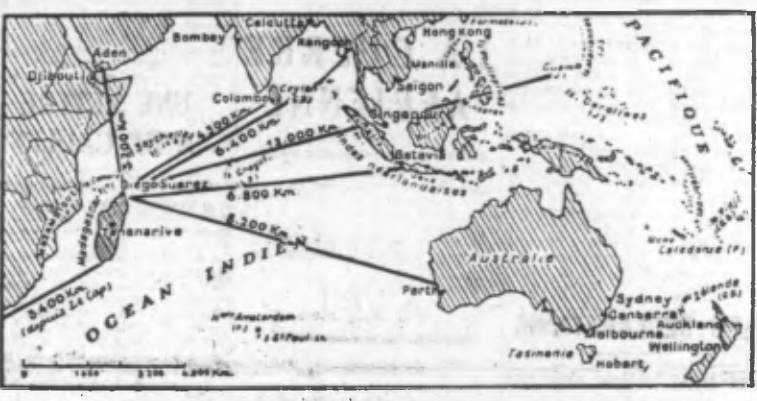
La situation de Madagascar par rapport aux Indes et aux îles de l'Océan Indien, et du Pacifique. (Lire la suite en deuxième page)