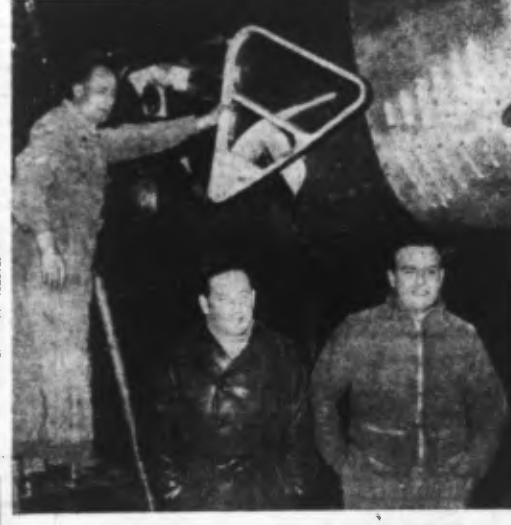
ASSOLANT et LEFÈVRE qui, en 1929, en compagnie de LOTI, effectuèrent le premier voyage aérien transatlantique avec charge.

Enfin, les opérations militaires sont ralenties. Le terrain d'aviation d'Anivarano-Nord a été rendu inutilisable dès le 8 mai. Mahaga n'est pas occupée. L'ennemi se retranche à 8 km. au nord-est sur la route des placiers à Antanariva. La progression est limitée dans le sud de Diégo-Suarez.