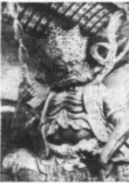
La statue d'un dieu très honoré, dans la région de YUNAN-FU.

On mande de Londres qu'à la Nouvelle Delhi on