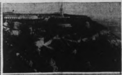
Deux aspects de la ceinture fortifiée de SEBASTOPOL, où se déroulent des combats acharnés. En haut, le couvent St-Georges; en bas, le couvent Espenaki.

Fortifications soviétiques (suite) Quartier général du Fuehrer, 9. — Le Haut Commandement allemand communique : Dans la région fortifiée de Sébastopol, les combats se poursuivent.