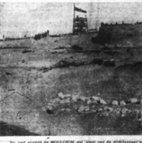
La fort élevée de BOLLOUM, qui, ainsi que de nombreuses places fortes, a été occupée par les troupes de l'Axe.

Jamais les Arabes ne toléreront que les Sionistes jouissent de droits particuliers en Palestine. Et c'est la raison pour laquelle, selon les paroles du Grand Mufti, le monde arabe tout entier souhaite la victoire des puissances de l'Axe car il voit en elles des alliées pour combattre les Anglais et les Juifs, leurs ennemis communs. S. M.