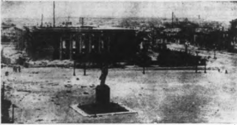
La statue de LENINE, sur la place de VORONEJE qui porte son nom.

Trois terroristes exécutés à Paris Paris, 24. — Trois des terroristes de la rue de Buci condamnés à mort par le tribunal spécial ont été exécutés dans la cour de la prison de la Santé. Une femme qui avait été, elle aussi, condamnée à mort, a vu sa peine commuée en celle des travaux forcés à perpétuité.