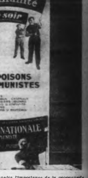
Un tableau qui, à l'Exposition, montre l'importance de la propagande communiste en France.

Il a donné à la place : LA MISÈRE, LA GUERRE, LA DÉFAITE.