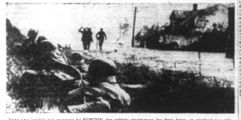
Dans une localité des environs de ROSTOV, des soldats soviétiques, les bras levés, se rendent aux Allemands, après avoir mis le feu aux maisons dans lesquelles ils se cachaient.