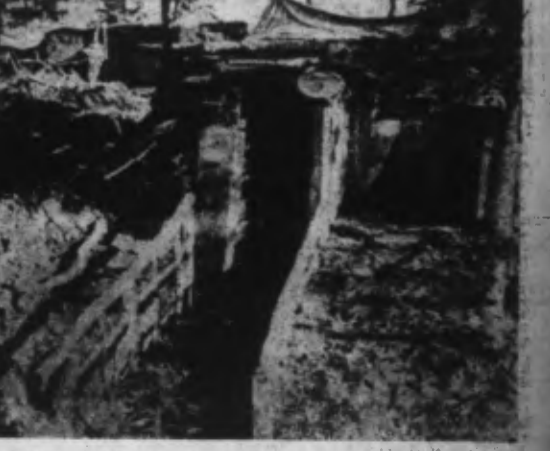
Les villages et tranchées dans le centre du front de l'Est.