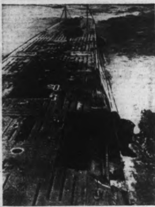
Des débris d'un vapeur ennemi qui explosa furent projetés en l'air et retombèrent sur ce sous-marin allemand qui fut sérieusement touché de toutes parts. Les réparations nécessaires furent faites en mer et le sous-marin est maintenant prêt à attaquer l'ennemi.

Montevideo, 30. — On mande de Montevideo au Service d'Informations britanniques : Hier, M. José Ameghino et M. Alberto Guani ont été élus respectivement président et vice-président de l'Uruguay.