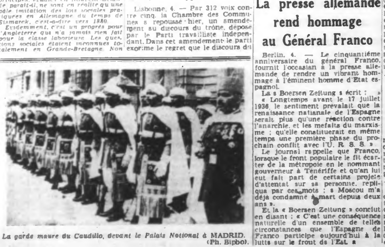
La garde maure du Caudillo, devant le Palais National à MADRID.

A la demande de Churchill et seulement, les conditions de vie de ceux qui jouissent plus en plus de bien-être. Sir William Beveridge a écrit un livre intitulé « Enquête sur les conditions de vie de la population ». Ce livre est une œuvre majeure de l'économie sociale. Il analyse les causes de la pauvreté et propose des solutions. Beveridge veut guérir l'Angleterre des maux du capitalisme sans toucher à celui-ci. Ses principes établis par Beveridge ne constituent en fait qu'une imitation des lois sociales en Allemagne du temps de Bismarck.