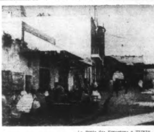
La bataille pour Tunis

Tous les avis d'écouter soigneusement chaque source de lumière n'ont pas donné le résultat attendu. Chaque jour de nouveaux manœuvres aux ordres d'occupation sont annoncés et des intrusions punies. Malgré l'augmentation des amendes aucune amélioration n'est constatée. En conséquence, à partir du lundi 7 décembre 1942 le courant sera coupé complètement pendant 3 jours pour tous les habitants des maisons dans lesquelles on observe une intrusion aux ordres d'occupation. Si le produit de nouvelles intrusions est constaté sans coupes pendant une semaine ou même plus longtemps. De plus le distingué expose à une punition sévère. Cet arrêté est valable pour toutes les communes de l'arrondissement de Lille et sera exécuté à partir du 7 décembre 1942. Lille, le 2 décembre 1942. Signé : Dr Schater, Oberst und Feldkommandant.