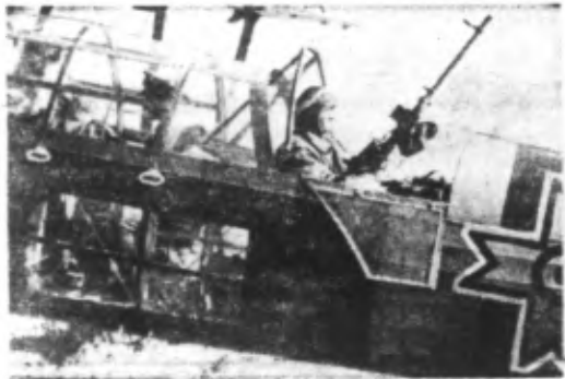
Action de reconnaissance roumaine près de l'ennemi.

Quartier Général du Fuehrer, 6. — Le Haut Commandement de l'Armée communique : En Tunisie, le nettoyage du champ de bataille aux environs de Tébourba s'est poursuivi. Le nombre des prisonniers s'est accru jusqu'à atteindre 1.900. Le nombre des chars blindés détruits s'élève à plus de 75, celui des canons capturés à plus de 50. L'aviation allemande a pénétré des colonnes ennemies ainsi que des débris de chars et de véhicules.