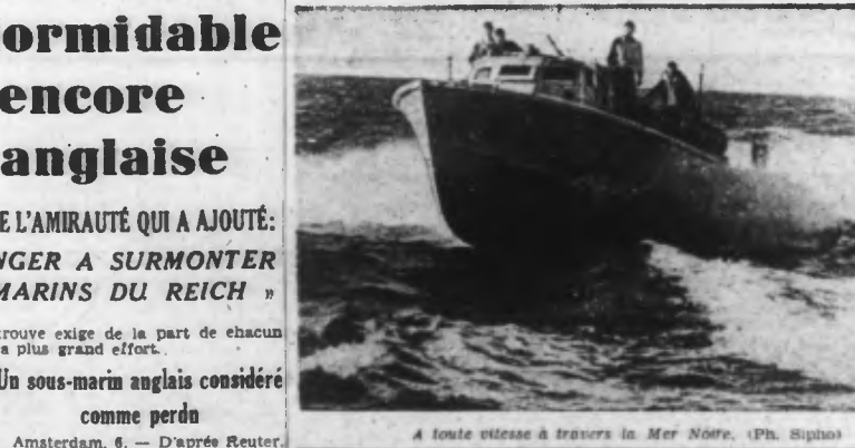
A toute vitesse à travers la Mer Noire.

Amsterdam, 6. — Suivant l'agence Reuter, le département de la Mer à Washington a fait savoir, pour la première fois, que lors de l'attaque japonaise contre Pearl Harbor, le 7 décembre 1941, 5 vaisseaux de ligne, 5 destroyers, un grand dock flottant et deux unités auxiliaires de la flotte américaine du Pacifique furent soit tués ou rendus inutilisables.