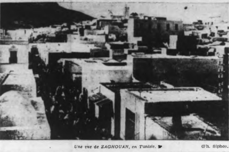
Une vue de ZAGHOUAN, en Tunisie.

Vichy, 22. — On estime dans les milieux officiels de Vichy, que le danger bolcheviste n'a jamais été aussi grand qu'aujourd'hui. On s'attend que 1943, la deuxième année de la guerre asiatique, connaîtra une évolution spirituelle et morale de la Chine.