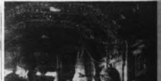
Dans un avion transporteur de troupes, au-dessus de la Méditerranée.

Berne, 22. — L'agence télégraphique suisse a publié le communiqué officiel suivant : Dans la nuit du 21 au 22 décembre, des avions britanniques ont, à deux reprises, violé la neutralité de l'espace aérien helvétique. Le premier survol s'est effectué entre 20 h 07 et 20 h 15. Les avions anglais, venant de l'Est, ont pénétré en Suisse entre Schaffouse et Fribourgedan et ont quitté entre Schaffouse et Arbon. Entre 21 h 37 et 22 h 05, des avions anglais venant de l'Ouest, ont survolé le canton de Schaffouse, violant une seconde fois le territoire helvétique. Les deux formations qui volaient à basse altitude, comprenaient de 10 à 15 appareils. Quelques avions isolés ont survolé aussi Bâle, le long du Rhin. L'aérielle a été donnée en Suisse orientale et centrale ainsi qu'à Bâle.