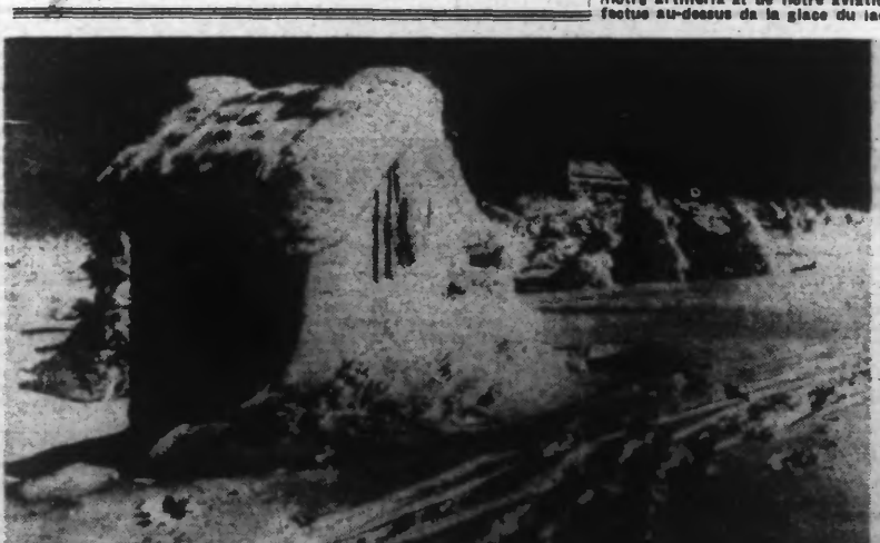
Effet de neige et de glace, à l'Est.