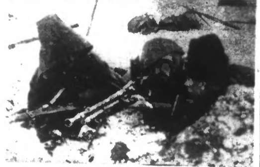
Infanterie roumaine pendant la campagne d'hiver.

Paris, 16. — Se référant à la visite du cardinal français Suhard dans la ville éternelle, le journal « Aujourd'hui » reproduit une dépêche de Rome annonçant que la situation de l'Église catholique en France a fait l'objet principal des conversations avec le pape. On croit savoir que l'archevêque de Paris aurait décrit la situation comme favorable. Il aurait souligné que les rapports avec l'autorité occupante étaient très cordiaux et que celle-ci autorisait toutes les manifestations religieuses. D'autre part, l'activité et le développement des organismes catholiques n'auraient fait l'objet d'aucune restriction.