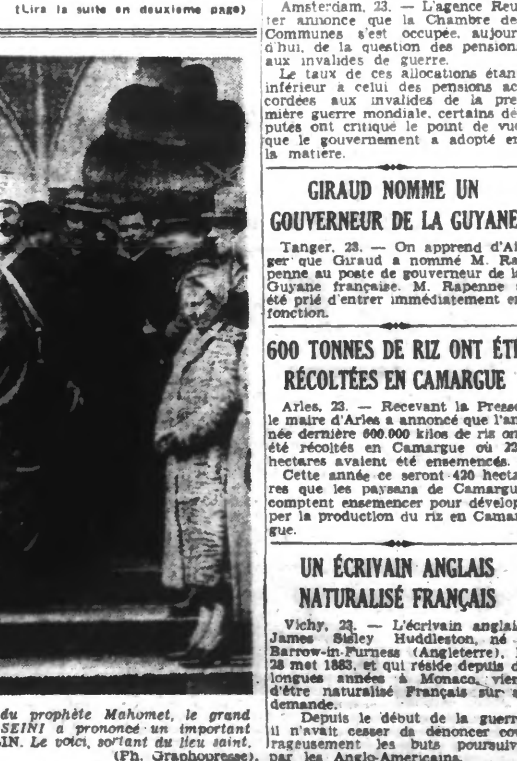
A l'occasion de l'anniversaire du prophète Mahomet, le grand Mufti de Jérusalem, Amin al HUSSEINI a prononcé un important discours dans la Mosquée de BERLIN. Le voici, soignant du lieu saint.

« La France devra entrer dans l'orbite soviétique » Genève 23. — On mande de New-York : Selon des informations reçues de Moscou, et notamment certains programmes de l'Agence Tass on se rendrait dans la capitale de l'U.R.S.S. que la Grande-Bretagne, l'association dédicée à défendre l'unité du pacte de l'Atlantique, et une autre avec la Russie, et en ce qui concerne les questions de sécurité en ce qui concerne les pays neutres et la Pologne.