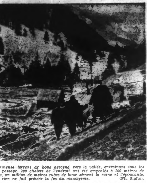
En HAUTE-SAOVIE, un immense torrent de boue descend vers la vallée, entraînant tous les arbres qu'il a renversés sur son passage. 200 chalets de l'endroit ont été emportés à 200 mètres de leurs fondations. Depuis le 10 Mars, six millions de mètres cubes de boue dévalent la ruine et l'épouvante de THONON à BELLEVANA, et rien ne fait prévoir la fin du cataclysme. (Ph. Siphon).