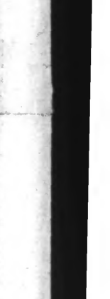
EN QUATRIÈME PAGE : « LE COIN DE LA FAMILLE »