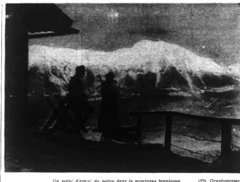
Un point d'appui de police dans la montagne bosniaque.

Washington, 14. — Les efforts pour renflouer le « Normandie » sont avérés vains jusque maintenant. On estime que le navire français ne sera pas remis à flot avant l'automne. Il faudra encore quelques mois pour que les travaux puissent être terminés après le renflouement.