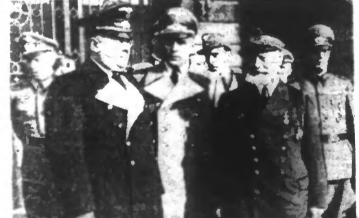
Venant de Tunisie et regagnant VICHY, l'amiral ESTEVA était ces jours derniers, de passage à PARIS. Le voici à sa sortie de l'hôtel, entouré des personnalités allemandes parmi lesquelles on reconnaît, le ministre SCHLEIER (à gauche).

LES « ALLIÉS » n'ont pas recouvré la liberté de navigation de la Méditerranée Genève, 18. — L'« Evening Standard » s'élève contre l'opinion de certaines personnes qui prétendent que les convois alliés peuvent maintenant naviguer de Gibraltar à Suez.