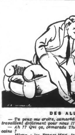
DES ALLIÉS NÉS

Vichy, 18. — L'amiral Esteva, représentant général de France en Tunisie, est arrivé à l'aérodrome de Vichy-Rhône à 11 heures. Il a été accueilli à sa descente d'avion par de nombreuses personnalités, il est aussitôt parti en voiture pour l'hôtel du Parc, où il a été immédiatement introduit dans le cabinet du Maréchal, chef de l'Etat. Au cours de cette entrevue, divers problèmes politiques ont été étudiés. Le chef de l'Etat a remercié l'amiral Esteva de sa fidélité et de la prudence qu'il a montrée dans les circonstances difficiles dans lesquelles il a été placé. L'amiral a présenté au Maréchal plusieurs officiers qui faisaient partie de son entourage. Le Maréchal a interrogé chacun des officiers et les a félicités d'avoir exécuté ses ordres jusqu'au dernier moment, dans les postes qui leur avaient été confiés. Le chef de l'Etat a décidé de les citer à l'ordre de la Nation. De son côté, le chef du gouvernement a reçu longuement au cours de l'après-midi l'amiral Esteva, qui lui a rendu compte de la façon dont il avait rempli sa mission. L'amiral lui a dit son désir de continuer à servir. Le président Laval l'a remercié de la volonté et du courage qu'il a montrés.