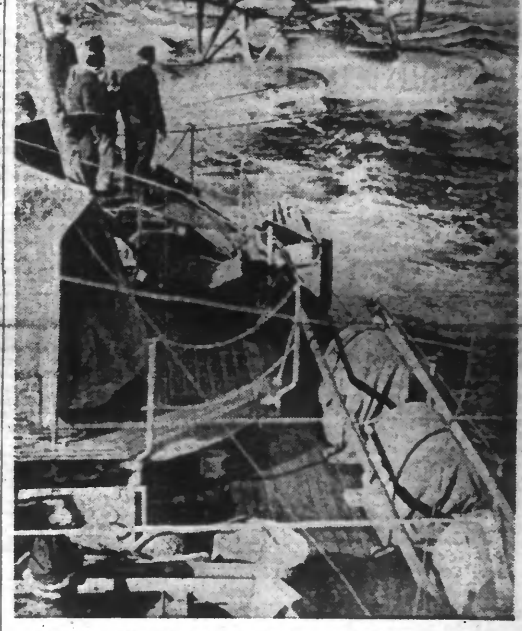
Un avion « He 115 » ayant ses moteurs endommagés trouve dans un port, un camarade, un petit vapeur en l'espace, qui le remorque.

Le plan d'invasion élaboré par les « Alliés » présenterait quelques « difficultés » Stockholm, 29. — Le « Nya Dagligt Allehanda » mande de Londres que l'opinion prévaut dans la capitale britannique que l'activité de Churchill à Washington a été plus fructueuse qu'il ne ressort de son discours au Congrès. Suivant le correspondant du journal suédois, certains milieux londoniens appréhendent que l'intendance diplomatique du premier ministre sur la nécessité de la guerre contre le Japon, soit une illusion aux dépens du plan d'invasion du continent, ébauché à Casablanca.