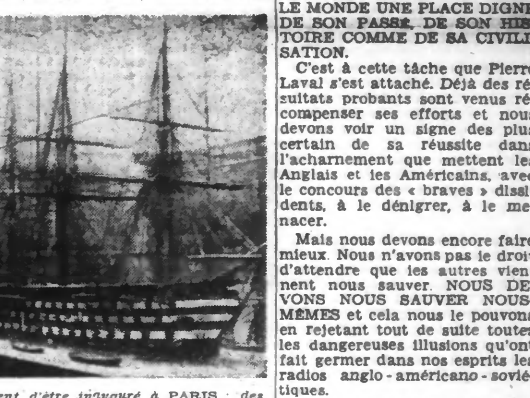
Le Musée de la Marine vient d'être inauguré à PARIS. Des visiteurs examinent une bien intéressante maquette.

Dans les jours qui suivront, nous aurons l'occasion de revenir sur les questions de ravitaillement, de marché noir, que le président Laval a traitées dans son grand et sincère discours.