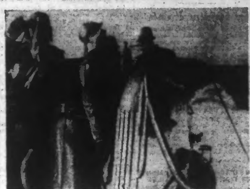
Le sous-marin ne se préoccupe pas seulement de l'horizon, le ciel aussi doit être l'objet de l'attention soutenue de ses officiers.

Lisbonne, 14. — On apprend que Staline vient de décerner l'archevêque de Canterbury la décoration de l'ordre de Lénine.