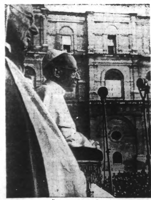
Le Pape a prononcé un discours dans la Cour du Belvédère au Vatican, devant 20.000 ouvriers italiens. Il a formellement condamné le bolchevisme et la franc-maçonnerie.

Paris, 22. — Le secrétaire de la mairie de Méricourt (Pas-de-Calais) et son adjoint vendaient des feuilles de tickets d'alimentation. Le tribunal d'Etat siègeant à Paris leur a infligé respectivement 8 et 5 ans de travaux forcés ainsi que la confiscation de leurs biens.