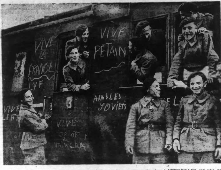
Le départ d'un nouveau contingent de la L.V.F. a eu lieu ces jours derniers à VERSAILLES. On voit, par cette photographie, que le moral des jeunes volontaires est excellent, ce qui est de bon augure. (Ph. Siphon).

Genève, 23. — Le correspondant spécial du « Daily Mail » de Londres annonce de Téhéran qu'un soulèvement s'est produit parmi les nomades du sud de l'Iran. Les insurgés, armés de mitrailleuses et de fusils, ont avancé vers le nord et occupé la ville de Firuzabad. Cette ville n'est pas très éloignée de l'infamie et l'attitude anglaise a poussé les nomades à se soulever. Le gouvernement iranien a envoyé des troupes pour refouler les insurgés dans les montagnes du sud de l'Iran.