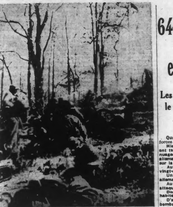
Artillerie légère japonaise prenant sous son feu des positions chinoises. (Ph. Sado).

Amsterdam, 26. — On mande de Washington que les Représentants de la Chambre des Représentants ont également adopté par 244 voix contre 180 la loi contre les grèves, 114 démocrates et 130 républicains ont voté contre Roosevelt.