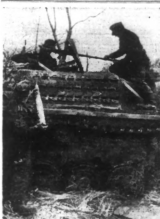
L'artillerie d'assaut, destinée à détruire les centres de résistance et à briser ainsi le chemin de l'infanterie, est une arme qui, pour la première fois, depuis cette guerre, est employée par l'Allemagne. Pendant la bataille, les hommes de l'artillerie d'assaut sont entièrement séparés des autres combattants. Ils sont seulement mis en communication avec leur unité par le service de télégraphie sans fil. Avant l'engagement on charge les munitions.