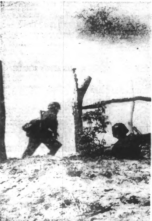
Sur le front du DONETZ, protégés par des nuages de fumée, des gradiers allemands transportent une mitrailleuse d'un endroit à un autre.

Quartier Général du Fushrer, 11 juillet. — Le Haut Commandement de l'Armée communique : La grande bataille de l'Est continue. Nos troupes ont réussi, dans de durs combats à étendre leur progression et à détruire 193 blindés ennemis. La Luftwaffe a soutenu au moyen de forces puissantes les attaques de l'armée de terre et ce malgré les mauvaises conditions atmosphériques. Des chars blindés et des concentrations de troupes ennemis ont été anéantis et 33 avions soviétiques abattus. De légères formations navales allemandes ont effectué, par surprise, un raid contre le port de Atschulev, dans la mer d'Azov ; elles réussissant à couler trois bateaux et à s'emparer gravement de trois autres.