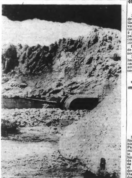
Logées dans les rochers de la côte de la Méditerranée, les batteries allemandes sont prêtes, dès l'alarme à entrer en action.