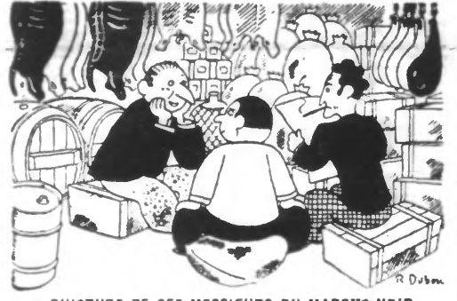
QUOTIDIEN DE CES MESSIEURS DU MARCHÉ NOIR

La conversion religieuse des Soviétiques n'est qu'une duperie de plus Lisbonne, 17. — Le journal catholique « Vox » s'occupe des informations relatives aux prétendues conversions religieuses des Soviétiques. Il s'agit d'une duperie de plus.