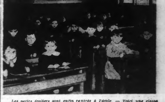
Les petits écoliers sont enfin rentrés à l'école. — Voici une classe d'enfants bien sages et attentifs.

Les écoles ont enfin ouvert leurs portes à nos écoliers et écolières après 110 jours de vacances. On sait dans quelles conditions s'est effectuée cette rentrée des classes : pour le plus grand nombre, c'est le régime de la demi-journée de travail, soit à peine 18 h. de cours par semaine. Il est sans doute bon de prendre des précautions en vue de la rentrée des classes, mais il est navrant qu'on soit obligé de prendre ces mesures au moment où la jeunesse scolaire a le plus besoin de nourriture intellectuelle.