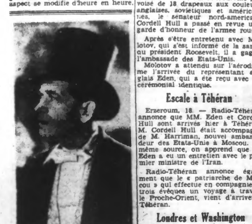
Albert PREJEAN dans une nouvelle production de films français : « Au Bonheur des Dames ».

Amsterdam, 18. — On mande de Washington à l'Agence Reuter qu'un rapport publié par la Commission sénatoriale de la marine souligne que la bataille de l'Atlantique continue à avoir une « très grande importance » et que son aspect se modifie d'heure en heure.