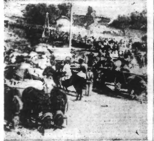
En UKRAINE, de longues files de prisonniers soviétiques cotoient de nos moins nombreux habitants qui se remplissent vers l'ouest. (Ph. Graphopresse).

au nord-est de Krivoriog mais furent repoussés en contre-attaque. Au sud et au nord de Kiev, ainsi qu'au nord-ouest de Tchernigov, il y a eu de violents combats, au cours desquels les Soviétiques ont été partout repoussés. L'ouest de Kriehow, les Bolchevistes ont passé à l'attaque sur un large front avec plusieurs divisions de tirailleurs. Par l'élan de nos contre-attaques les efforts ennemis furent stoppés et les formations assaillantes ennemies rejetées sur leurs positions de départ. On annonce une activité de combat local dans la région située à l'est de Smolensk et au sud de Veliki-Louki. La Luttwaffe qui coopère avec les troupes aériennes roumaines a particulièrement soutenu les troupes engagées dans de durs combats défensifs au sud du front de l'Est, à Sabatta, dans la période du 22 au 25 octobre, 128 avions soviétiques, 14 de nos appareils sont portés manquants pour la même période.