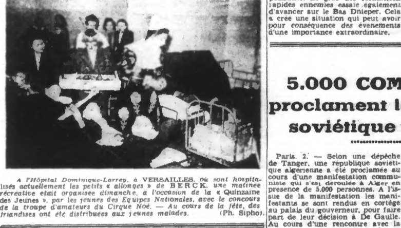
A l'Hôpital Dominique-Larrey, à VERSAILLES, où sont hospitalisés actuellement les petits « allongés » de BERCK, une matinee récréative était organisée dimanche, à l'occasion de la « Quinzaine des Jeunes », par les jeunes des Eclaireurs Nationaux, avec le concours de la troupe d'amateurs du Cirque Noé. — Au cours de la fête, des friandises ont été distribuées aux jeunes malades.

Paris, 2. — Selon une dépêche de Tanger, une République soviétique algérienne a été proclamée au cours d'une manifestation communiste qui a eu lieu à Alger, le 2 novembre, devant une foule de 5.000 personnes. A l'issue de la manifestation les manifestants se sont rendus en cortège au palais du gouverneur, pour faire passer à ce haut fonctionnaire les déclarations de la République soviétique algérienne. Le communiqué officiel de ce jour, publié par le D.N.B., dit que la manifestation a été organisée par le parti communiste algérien, qui a été proclamé par les dirigeants du parti communiste algérien. « Cette manifestation a été organisée par le parti communiste algérien, qui a été proclamé par les dirigeants du parti communiste algérien. »