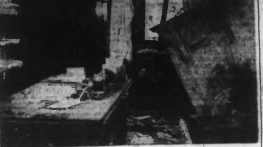
Aux cours du bombardement du Vaticain par les Anglo-Américains, des débris ont été causés notamment dans le bureau du Gouverneur du Palais, ainsi que le montre notre photo.

M. LAGARDELLE, maintenant sa démission, M. BICHELONNE est chargé d'assurer l'intérim au Secrétariat d'Etat du Travail