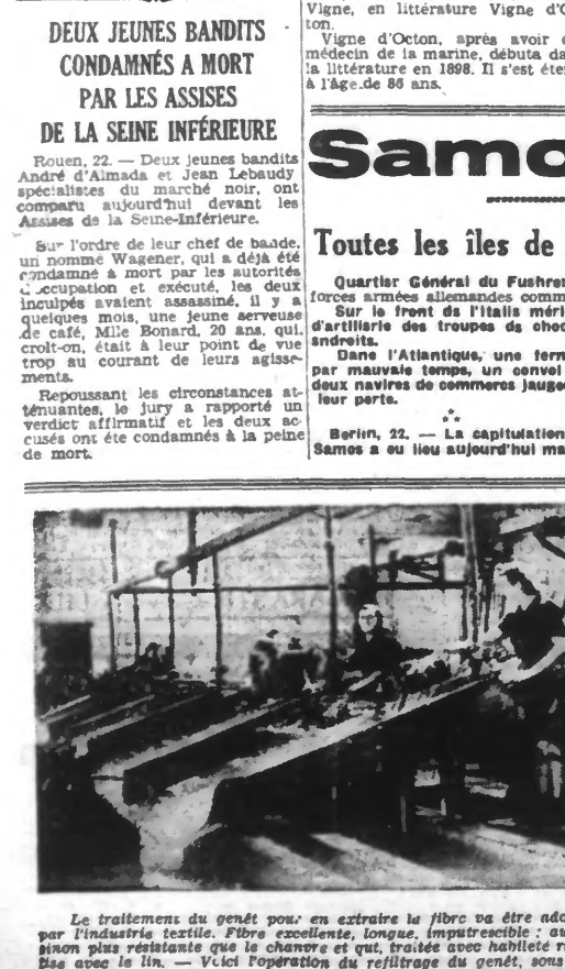
Le traitement du génét pour en extraire la fibre ou être adapté pour l'industrie textile. Fibre excellente, longue, impatissable ; aussi, sinon plus résistante que le chanvre et qui, traitée avec habileté résout avec le lin. — Vicij Opération du raffinage du génét, sous un jet d'eau de l. k. de pression.

Vichy, 22. — L'examen du budget de 1944 est à peu près achevé. Le comité budgétaire publiera le projet d'ensemble dès la première séance du mois prochain.