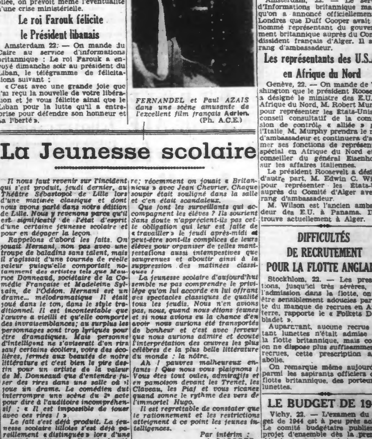
FERNANDEL et Paul AZAIS dans une scène amusante de l'excellent film français Adrien.