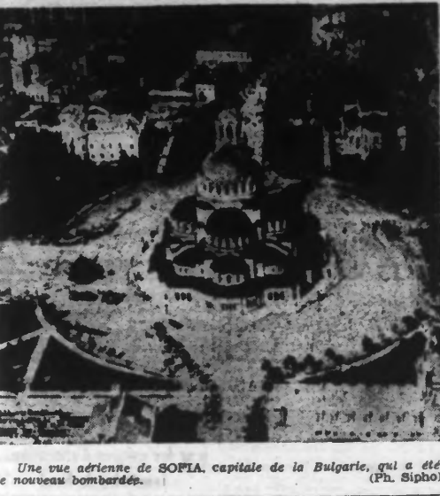
Une vue aérienne de SOFIA, capitale de la Bulgarie, qui a été de nouveau bombardée.

L'évacuation de Gomel et la défense élastique