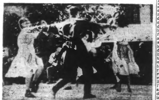
Tarriers dansant. Leurs propres danses ne sont pas seules à leur plaisir ; volontiers, ils empruntent celles des Russes, des Roumains, des Tchérkes, etc.

Berlin, 26. — Le correspondant militaire du D.N.B., Martin Haltenböber, écrit au sujet de la situation sur le front de l'Est :