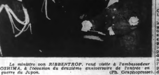
Le ministre von RIBBENTROP, rend visite à l'ambassadeur OSHIMA, à l'occasion du deuxième anniversaire de l'entrée en guerre du Japon.