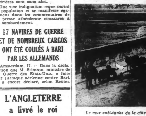
Le mur anti-tanks de la côte sud de la France.