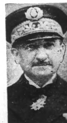
L'Amiral DECOUX avaient causée les agressions terroristes sur Hanoi et Halphong, e de l'inclinaison, a-t-il dit, devant les corps des victimes qui ont été assassinés