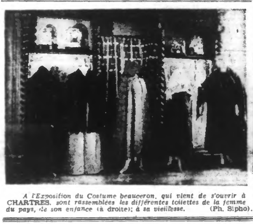
À l'exposition du Costume beauceron, qui vient de s'ouvrir à Chartres, sont rassemblées les différentes toilettes de la femme du pays, de son enfance à droite; et à sa vieillesse.

Tokio, 22. — Une dépêche Domei annonce que le 21 décembre une formation de bombardiers et de chasseurs nippons a exécuté une série de raids fructueux contre l'aérodrome de Kweilin, endommageant gravement les installations militaires de l'ennemi. Le même jour, une autre et plus importante formation de bombardiers et de chasseurs nippons a attaqué Tchansha, position clé de la zone de guerre ennemie. D'autre part, un groupe d'avions nippons a attaqué par surprise