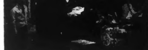
Le bombardement de Sofia.