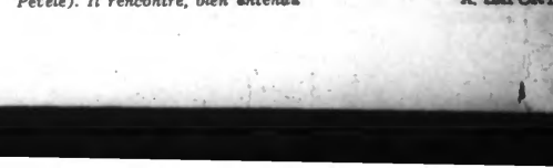
Le bombardement de Sofia.