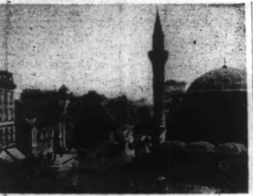
UNE VUE DE SOFIA.

Genève, 5. — On mande de Londres : Celui qui occupe Rome possède le cœur du peuple italien, encore déclaré récemment à une conférence de presse, le général Alexander.